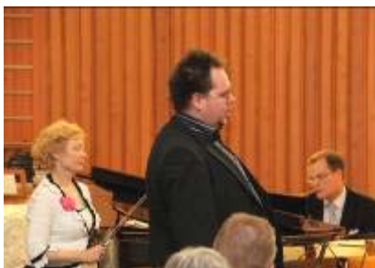
Kammarorkestern Trio Ardiente från Kymi sinfoniatta applåderades tillbaka till estraden.