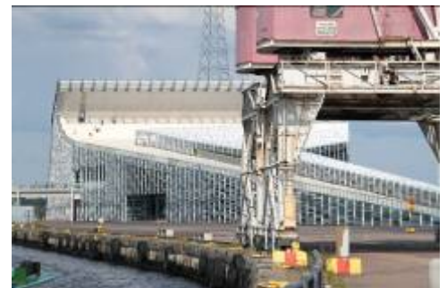
Maritimcentret Vellamo påminner med in arkitektur om en svallvåg. En stor grupp av festdeltagarna besökte centret.