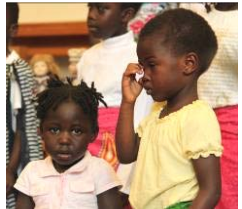
Huvudfesten på söndagen inleddes med ett anslående och intagande sångnummer av barn från Sudan.